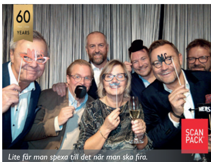
Lite får man spexa till det när man ska fira.