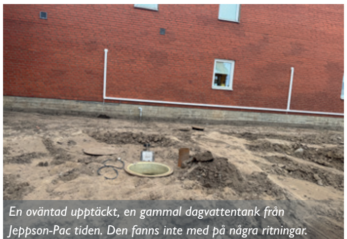
En oväntad upptäckt, en gammal dagvattentank från Jeppson-Pac tiden. Den fanns inte med på några ritningar.