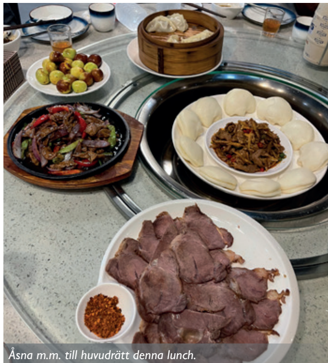
Åsna m.m. till huvudrätt denna lunch.

Lite shopping hanns också med, innan det blev lunch och lite annorlunda smakupplevelser för oss alla. På kvällen blev det traditionell Hot Pot och en öl från Chongqing, en härlig promenad på kvällen i närområdet innan det blev dags för färd mot hotellet för välbehövlig sömn.