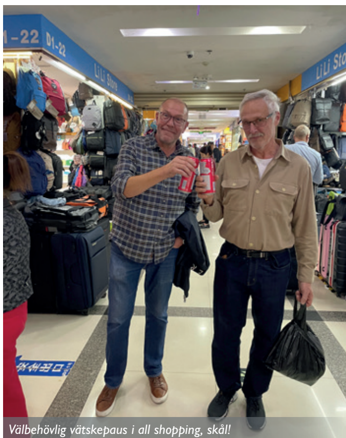
Välbehövlig vätskepaus i all shopping, skål!