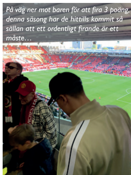
På väg ner mot baren för att fira 3 poäng, denna säsong har de hittills kommit så sällan att ett ordentligt firande är ett måste...