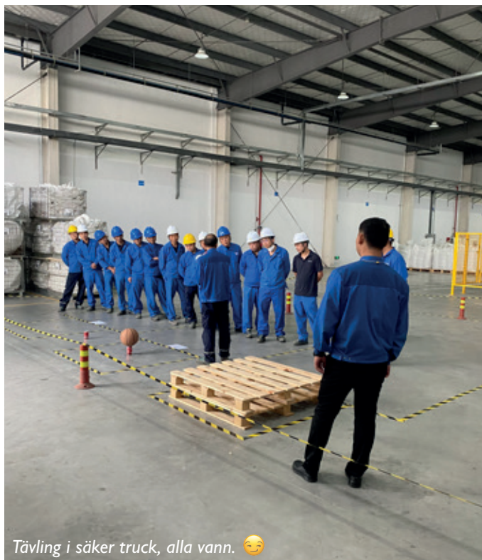
Tävling i säker truck, alla vann. 😊

Vi fick en rundvandring och en presentationsrunda av alla våra kolleger i Kunshan, ett väldigt fint välkomnande från alla där, de gjorde verkligen sitt bästa så att vi fick så mycket information som möjligt från alla berörda.