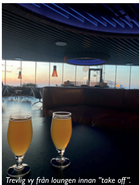
Trevlig vy från loungen innan "take off".