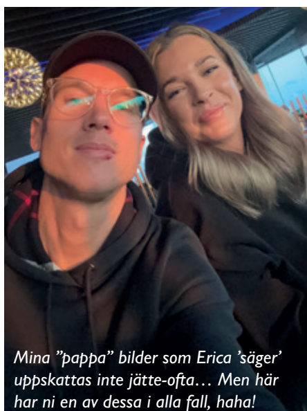
Mina "pappa" bilder som Erica 'säger' uppskattas inte jätte-ofta... Men här har ni en av dessa i alla fall, haha!