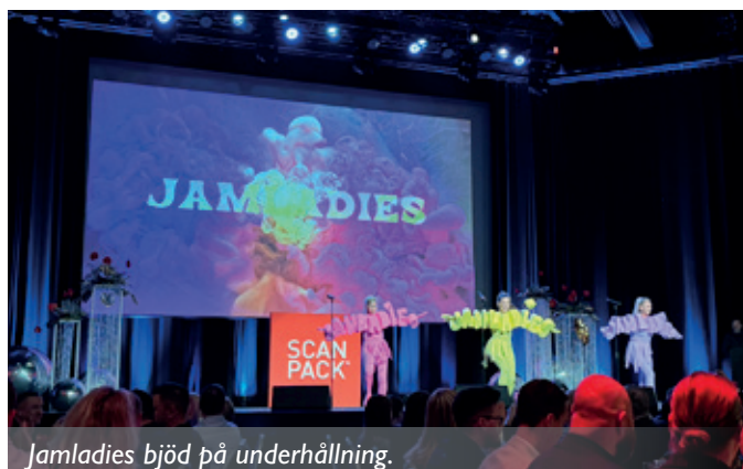
Jamladies bjöd på underhållning.

vi alla fick en trevlig middag tillsammans på mässans egna festlokal med stor scen.