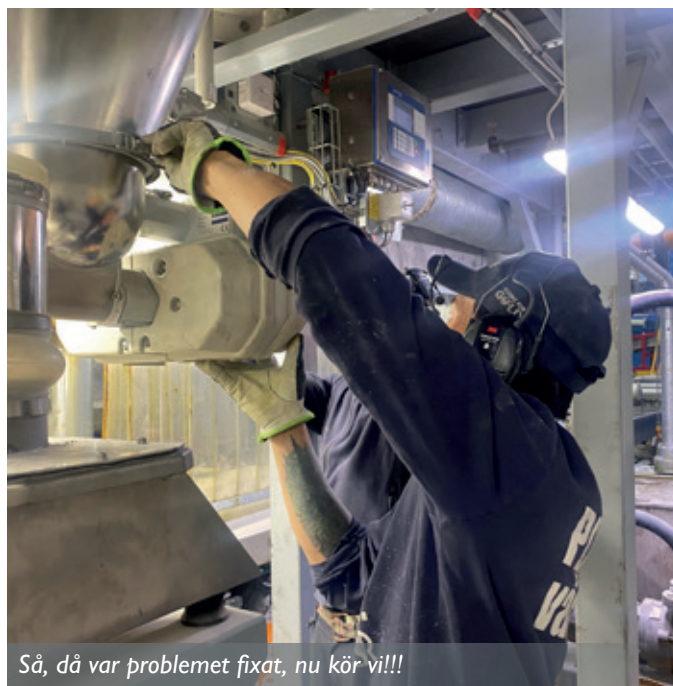
Så, då var problemet fixat, nu kör vi!!!

En historia om samarbete, problemlösning och vikten av att alltid ha kompetenta medarbetare på plats.