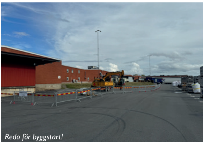
Redo för byggstart!