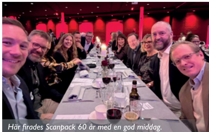
Här firades Scanpack 60 år med en god middag.

Sedvanliga teambuilding-festen var i år på onsdagen, vilket betydde att hela Scanfill-gänget tog sig upp till Göteborg för att fira Scanpack 60 år. Vi hängde, igen, ihop med Treform som hade Bama-gänget med sig och