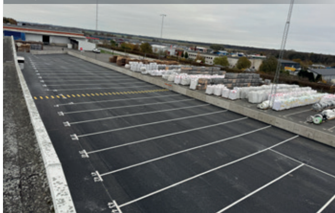
Färdigt resultat sett från taket.