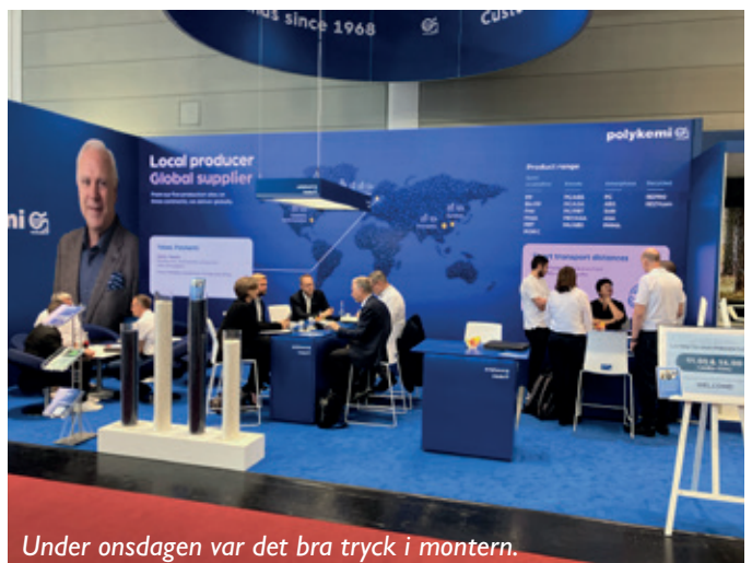
Under onsdagen var det bra tryck i montern.

För vår egen del så hade vi år en ny monterdesign och det var inte bara vi själva som tyckte den var fin och stack ut i mängden.