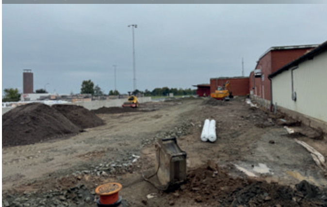
Hårdgörning och höjdstjustering.