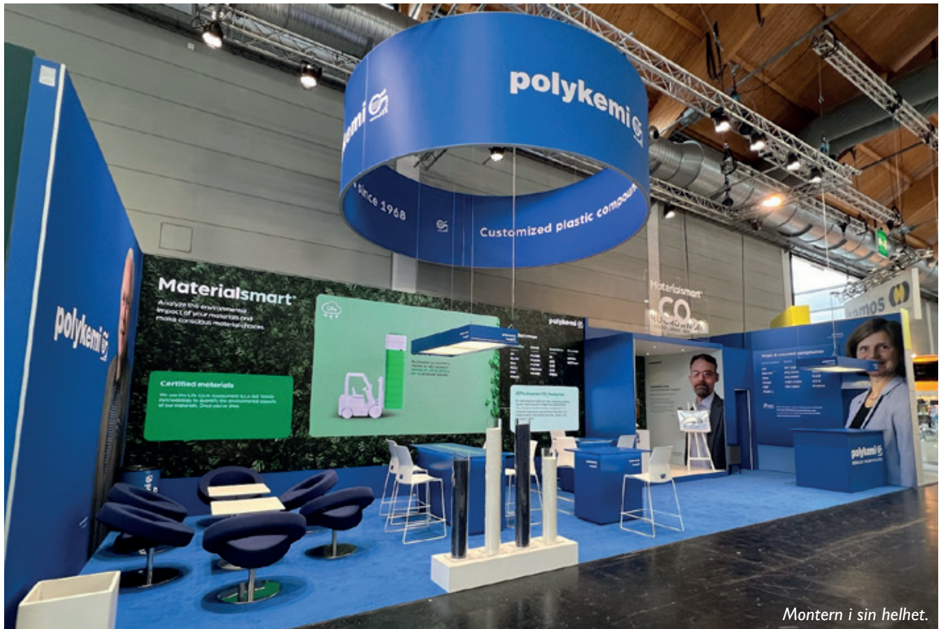
Montern i sin helhet.

ÄVEN I ÅR STYRDE VI KOSAN MOT BODENSJÖN FÖR ATT UNDER DAGARNA FEM STÄLLA UT PÅ FAKUMA-MÄSSAN I FRIEDERICHSHAFEN.