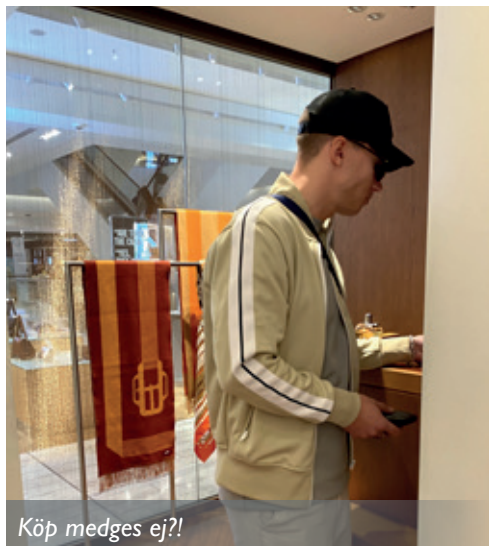
Köp medges ej?!