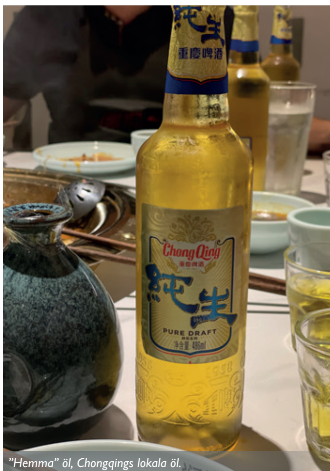
"Hemma" öl, Chongqings lokala öl.

Lite shopping hanns också med, innan det blev lunch och lite annorlunda smakupplevelser för oss alla. På kvällen blev det traditionell Hot Pot och en öl från Chongqing, en härlig promenad på kvällen i närområdet innan det blev dags för färd mot hotellet för välbehövlig sömn.