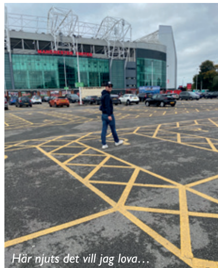
Här njuts det vill jag lova...

Matchdagen var äntligen kommen och då var det dags att ta oss in mot kärnan och sätta oss på puben jag nämnde tidigare. Tur var nog att vi blev inbjudna till deras bord, för att komma in där under matchdag var väldigt tufft fick jag höra. Trevligt snack med likasinnade människor och god öl.