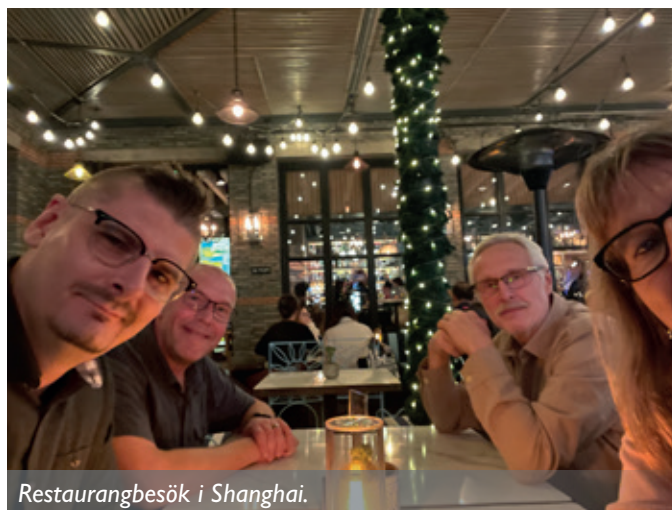
Restaurangbesök i Shanghai.