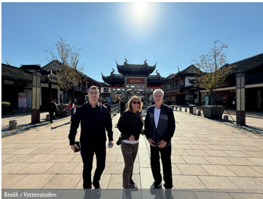
Besök i Vattenstaden.