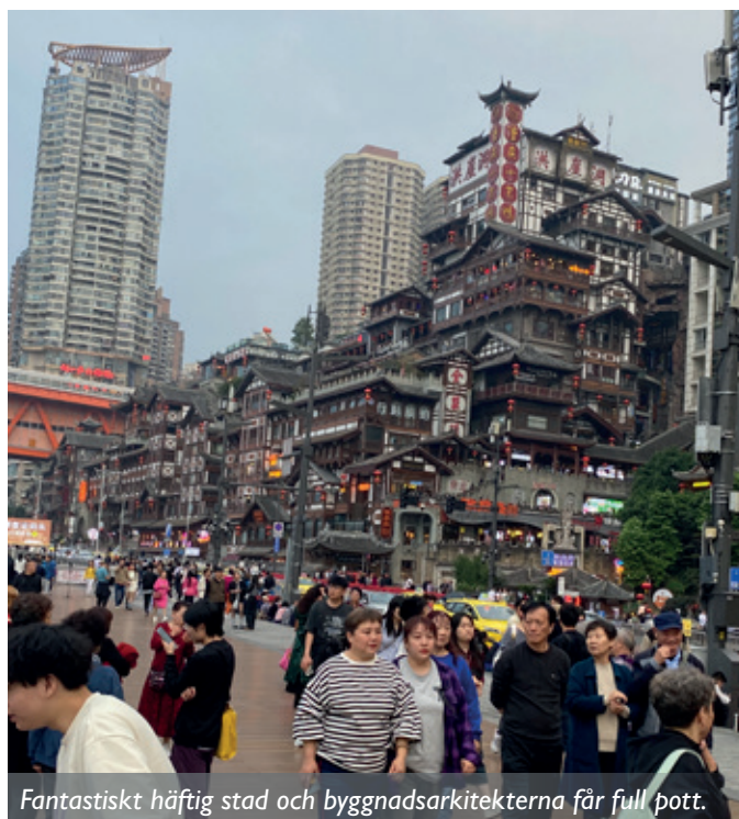
Fantastiskt häftig stad och byggnadsarkitekterna får full pott.