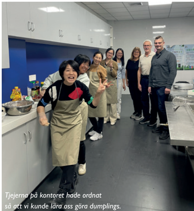
Tjejerna på kontoret hade ordnat så att vi kunde lära oss göra dumplings.

Vi anlände till företaget på förmiddagen och då fick vi lära oss att göra dumplings, alla tjejerna på kontoret hade fixat och förberett så att allt var på plats när vi kom, det var svårt men vi fick god hjälp att få till det, detta avnjöts sedan till lunch och det var supergott.