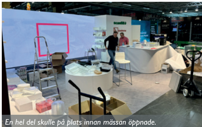
En hel del skulle på plats innan mässan öppnade.

Mässan är inte vår mest besökta som vi ställer ut på, det är nog den minsta, men samtidigt är det hemma-marknadens mäsas och det visade sig att synergien med att ha med oss Treform i montererna var väldigt, väldigt uppskattad och hjälpte dem massor. Största fördelen är att vi var på plats och kunde hjälpa dem svara på frågor kring material, som de annars behövt återkomma med till kunderna. Skoj även i detta syftet att vi fick ut det vi ville med en gemensam monter.