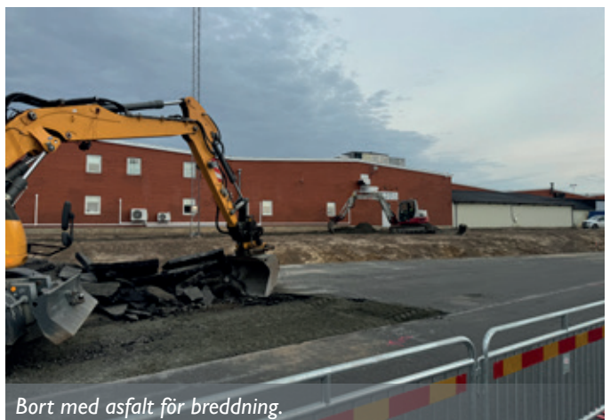
Bort med asfalt för breddning.