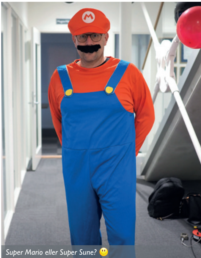
Super Mario eller Super Sune? 😊