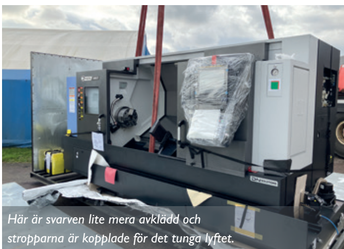
Här är svarven lite mera avklädd och stropparna är kopplade för det tunga lyftet.