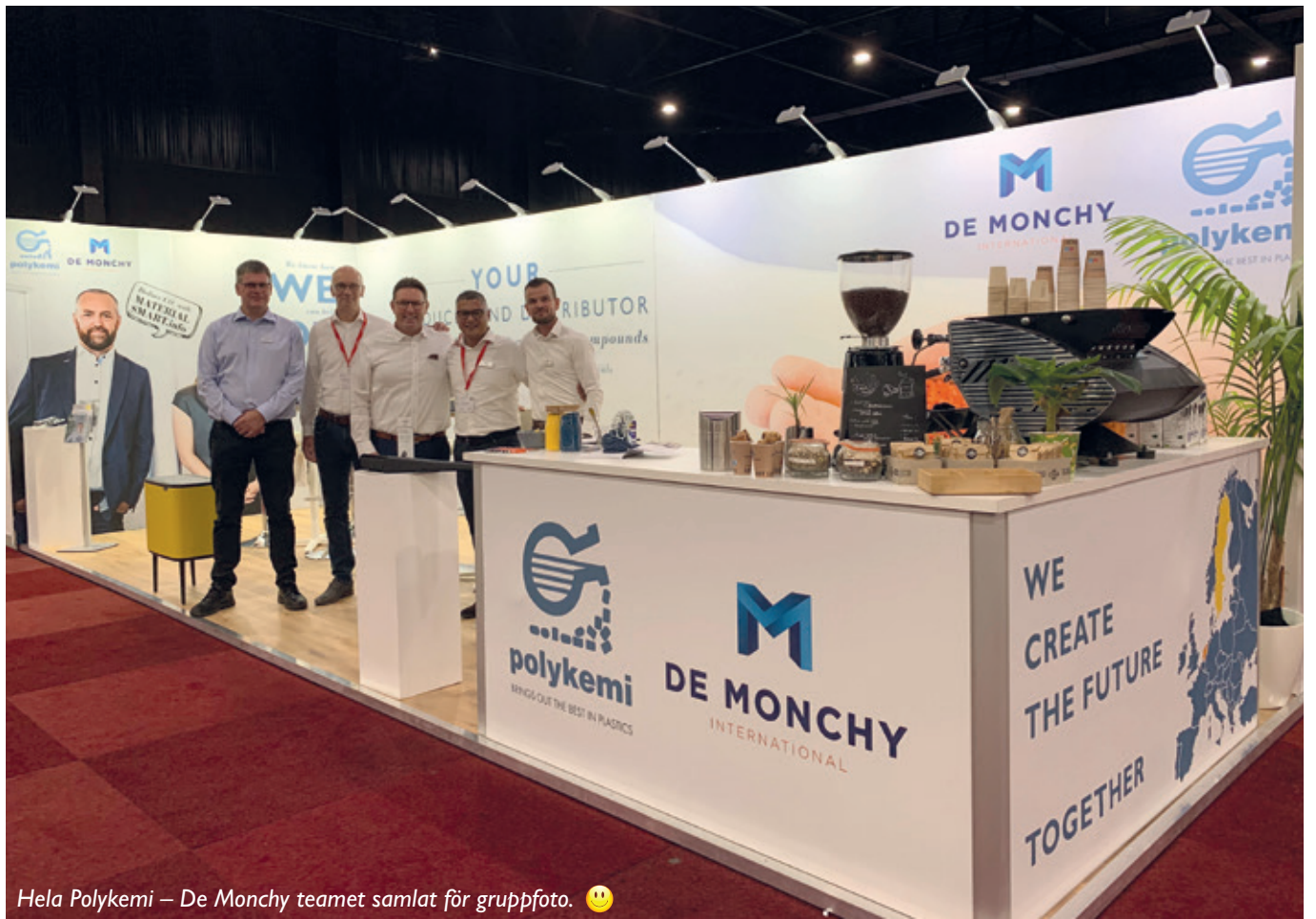
Hela Polykemi – De Monchy teamet samlat för gruppfoto. 😊