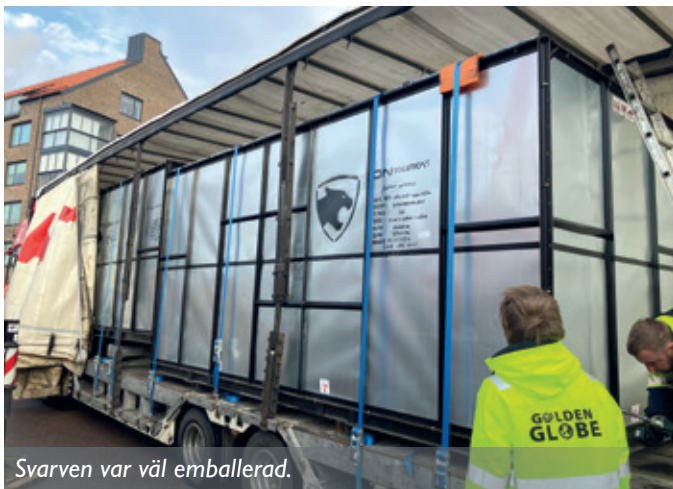
Svarven var väl emballerad.

Den största skillnaden ligger i att på den nya svarven finns det drivna verktyg som gör arbetet med att t.ex. tillverka matarrullar