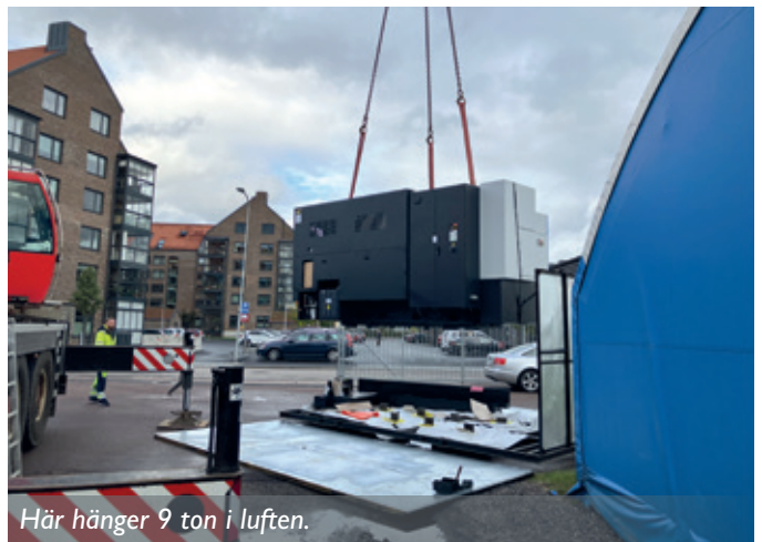
Här hänger 9 ton i luften.