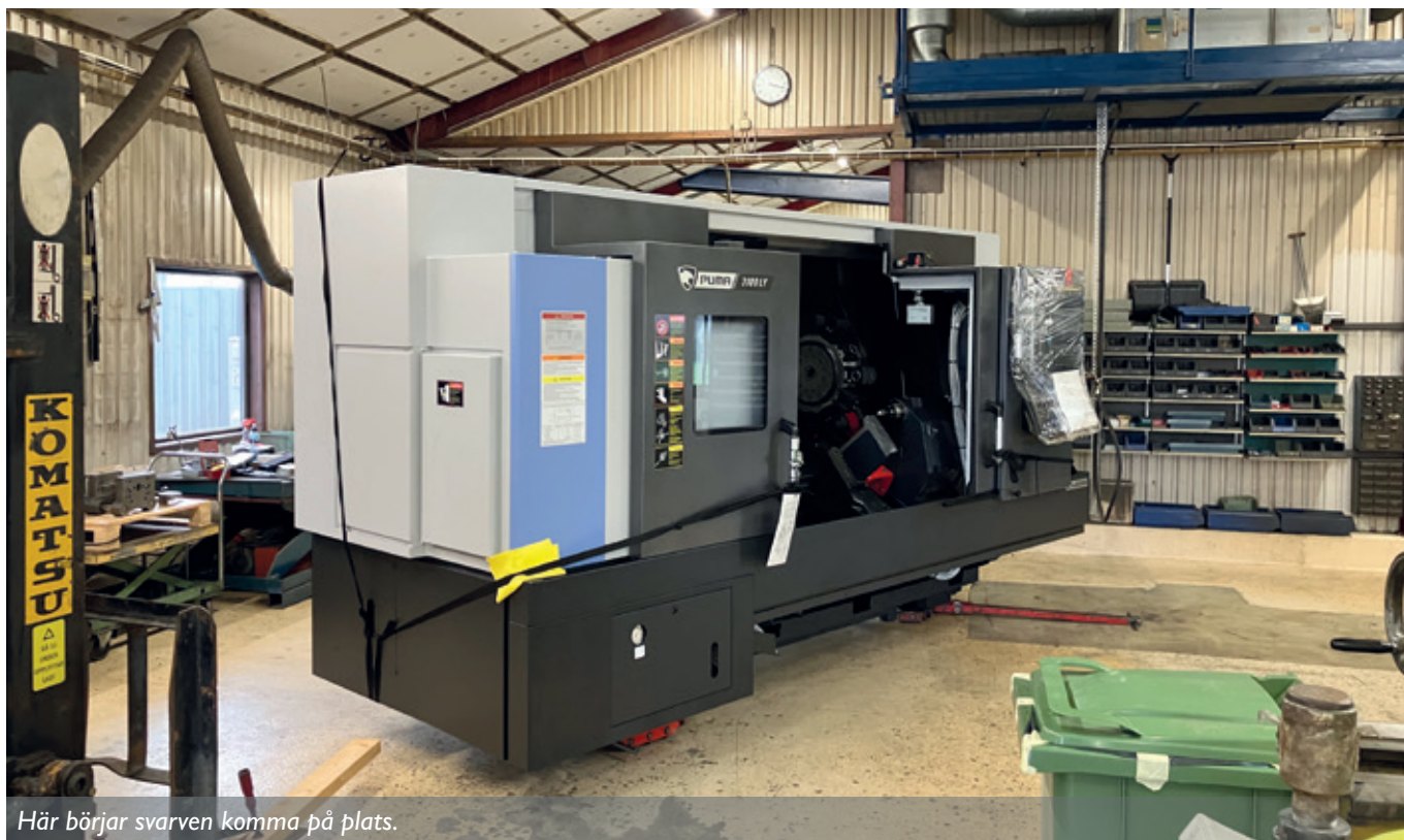
Här börjar svarven komma på plats.

till klipparna mycket effektivare. Sedan finns det stora skillnader på ett styrsystem från 1989 mot ett från 2022.