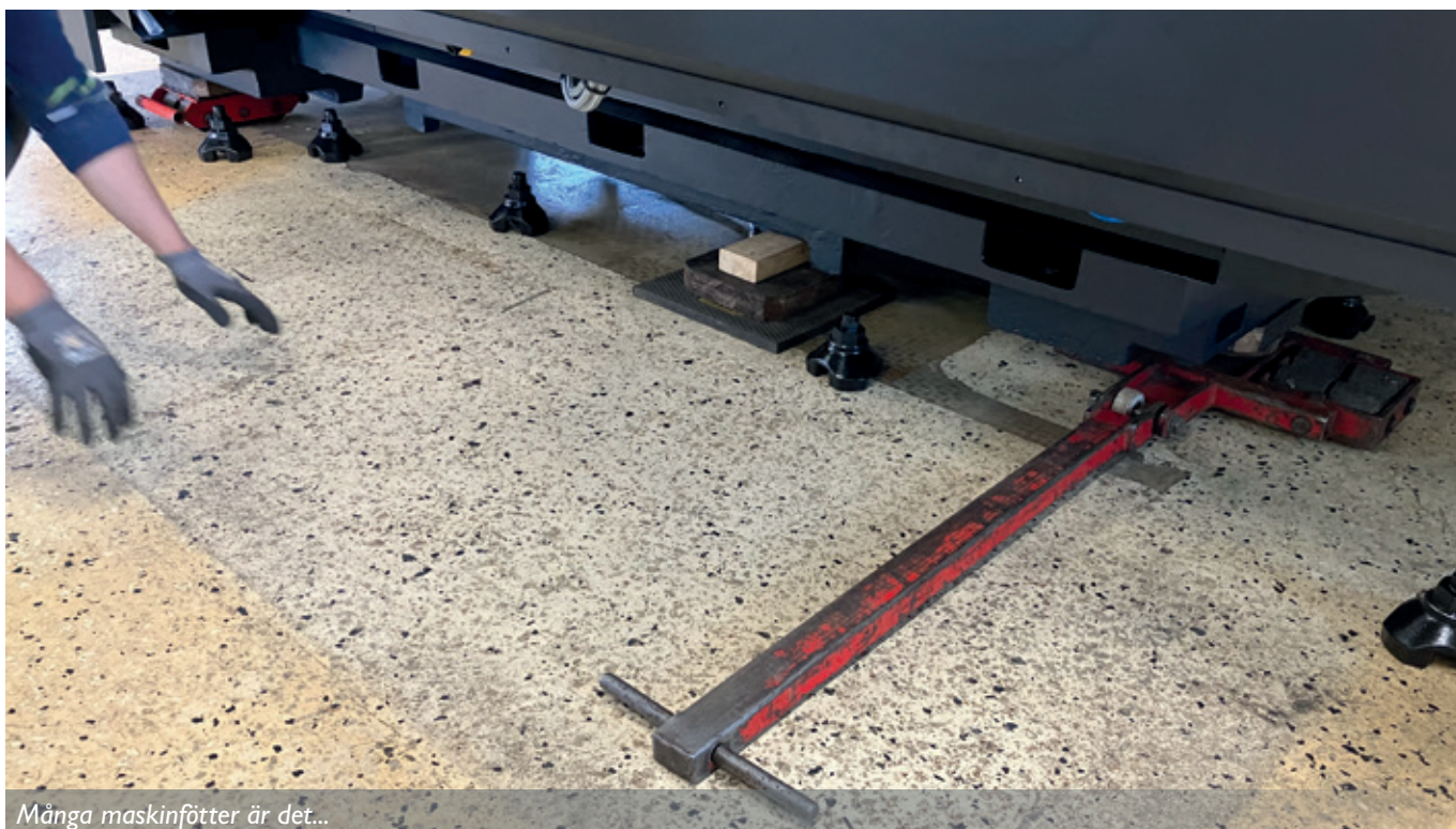
Många maskinfötter är det...