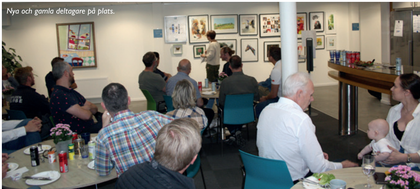
Nya och gamla deltagare på plats.