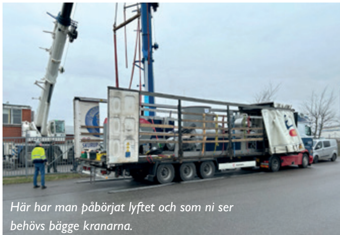
Här har man påbörjat lyftet och som ni ser behövs bägge kranarna.