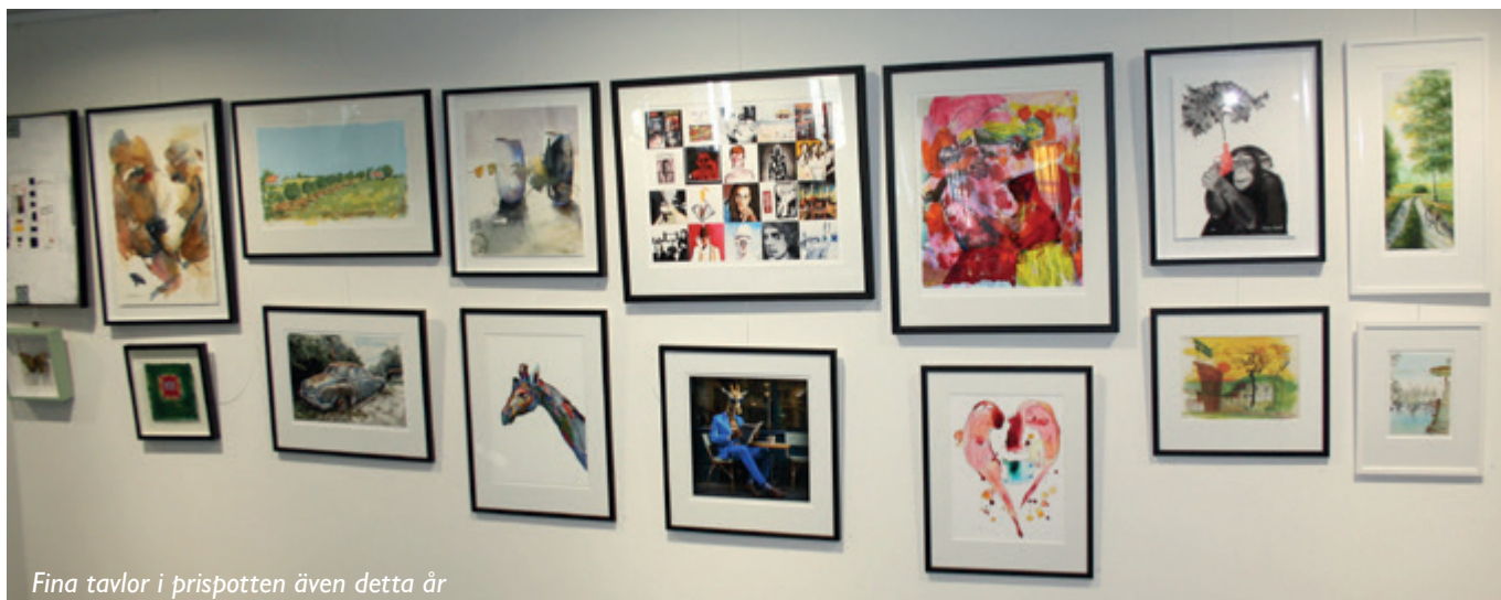
Fina tavlor i prispotten även detta år

17:E MAJ, NORGES NATIONALDAG TILL ÄRA, VAR DET DAGS FÖR VÅR ÅRLIGA DRAGNING I KONSTKLUBBEN. DET VAR LIKA GOD UPPSLUTNING SOM VI VANT OSS VID DE SENASTE ÅREN, SÅ ROLIGT! VI HAR ÄVEN FÅTT NÅGRA NYA MEDLEMMAR UNDER ÅRET OCH DET ÄR OCKSÅ VÄLDIGT ROLIGT!