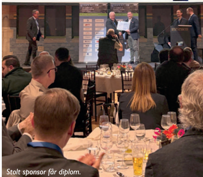
Stolt sponsor får diplom.