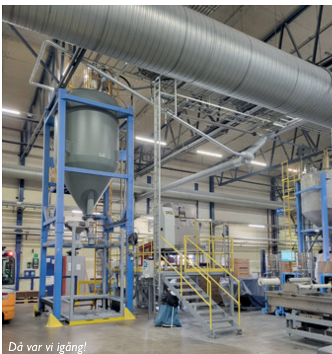
Då var vi igång!

Den stora skillnaden mellan nya Extruder 19 och tidigare motsvarande maskiner är att den är specialbyggd för att kunna producera PC/ABS med återvunnen råvara. En ny innovativ skruvdesign i kombination med ett materialhanteringssystem i form av batchmixer är en del av nyheterna för att lyckas med detta.