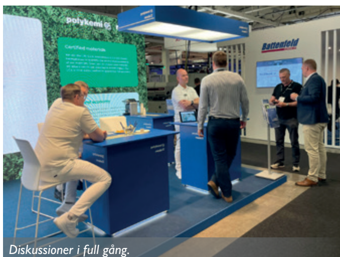
Diskussioner i full gång.