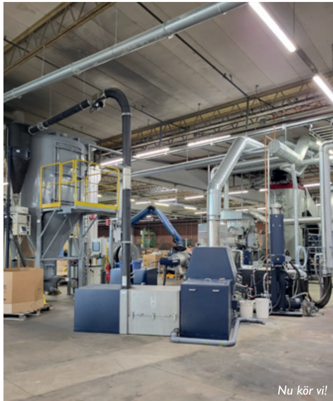
Nu kör vi!