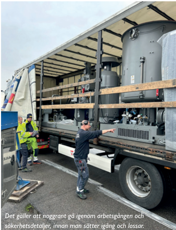
Det gäller att noggrant gå igenom arbetsgången och säkerhetsdetaljer, innan man sätter igång och lossar.

POLYNEWSREDAKTIONEN FICK NYS OM ATT EN NY EREMA SKULLE KOMMA PÅ PLATS UPPE PÅ "BAKKEN" HOS RONDO.