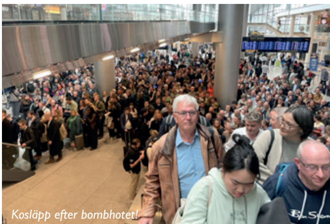
Kosläpp efter bombhotet!

Väl inne i incheckningen så står allt stilla. Mängder av människor står bara och tittar, ovanligt förvirrat. Inga diskar är öppna och vi blir helt ställda. Det visade sig att säkerhetskontrollen var stängd på grund av ett mystiskt objekt. INGEN vet hur lång tid detta kommer att ta. Vi står och väntar i nästan 3 timmar innan incheckningen öppnar igen. Under den tiden ser vi flertalet polishundar, troligtvis en bombdräkt, spanare och massor av poliser röra sig snabbt bort till säkerhetskontrollen. Alla trodde det rörde sig om en bomb, men i efterhand tror vi inte det var det, eftersom vi inte behövde evakuera byggnaden.