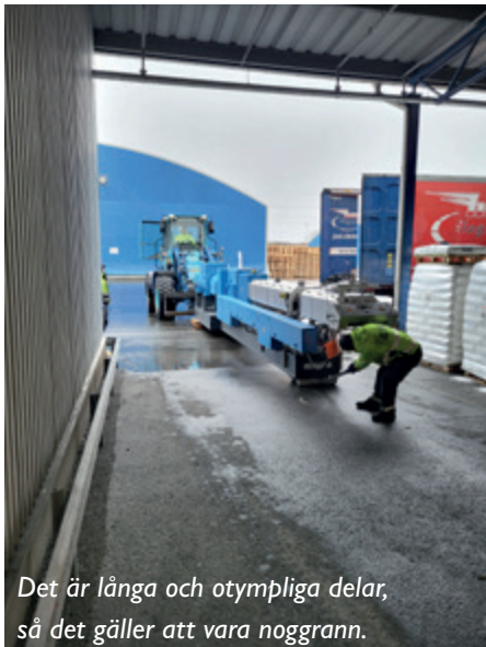
Det är långa och otympliga delar, så det gäller att vara noggrann.