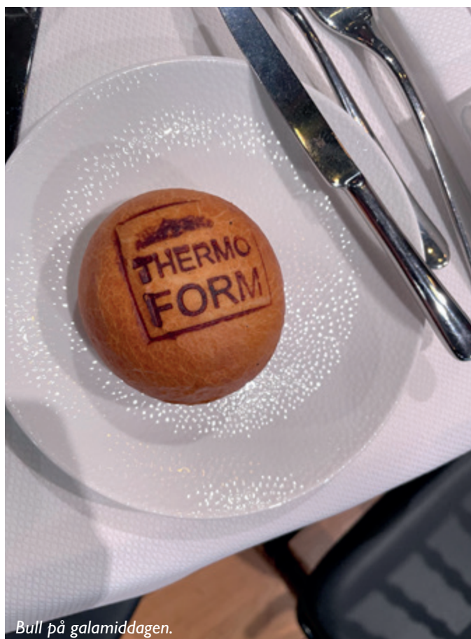
Bull på galamiddagen.

Vi är väldigt nöjda med vår kortvecka i Amsterdam och kommer mest troligen att komma tillbaka till eventet om 2 år när nästa event går av stapeln.