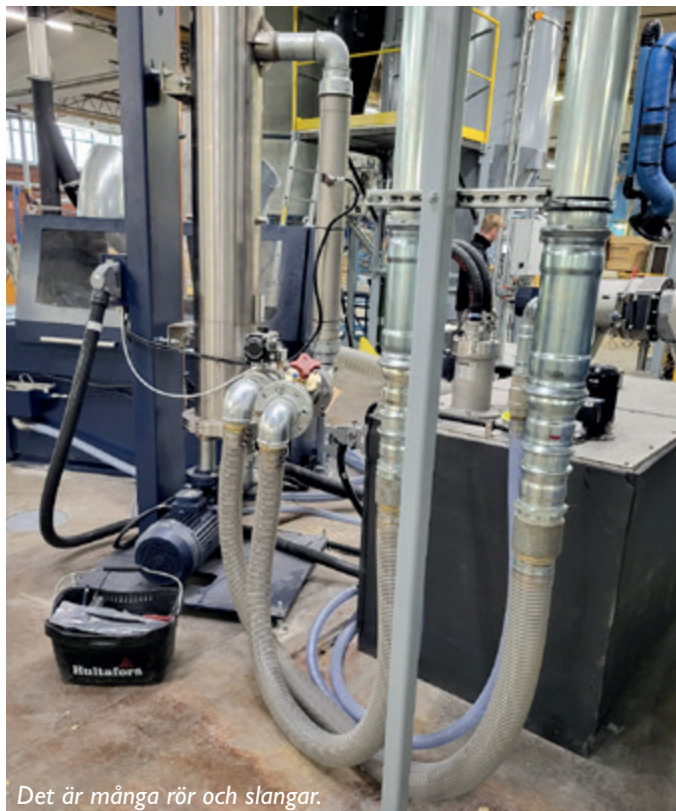
Det är många rör och slangar.