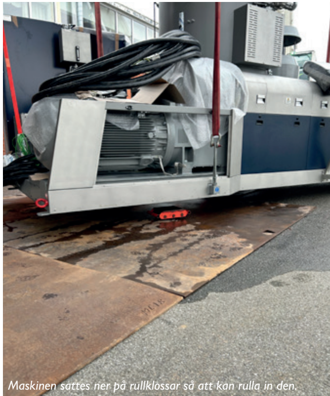
Maskinen sättes ner på rullklossar så att kan rulla in den.