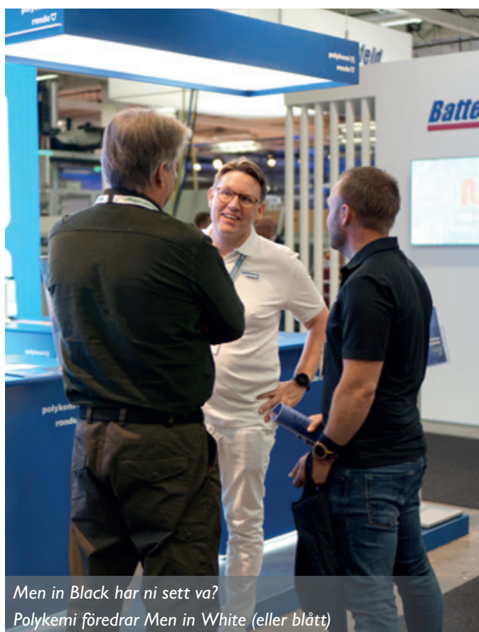
Men in Black har ni sett va? Polykemi föredrar Men in White (eller blått)