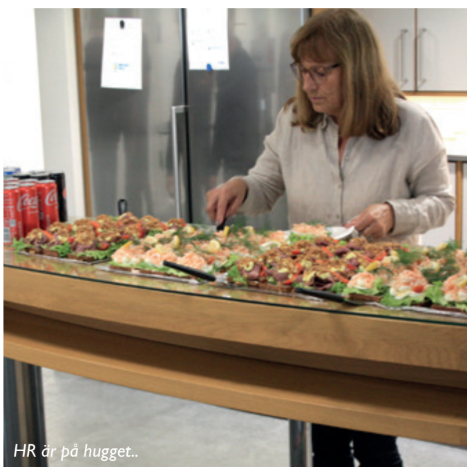
HR är på hugget..

Smörrebrö från Anna-Berthas Bistro var minst lika goda i år och tavlorna var noga utvalda hos Galleri Ardenno i Torna Hällestad. Sammanfattningsvis kan jag säga att allt var sig likt.