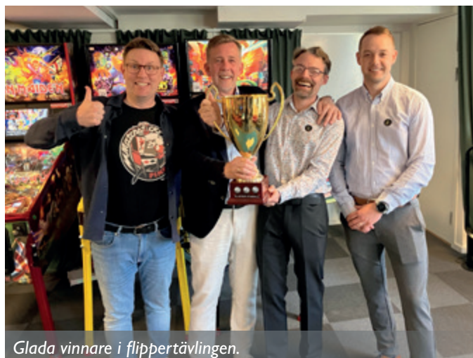
Glada vinnare i flippertävlingen.