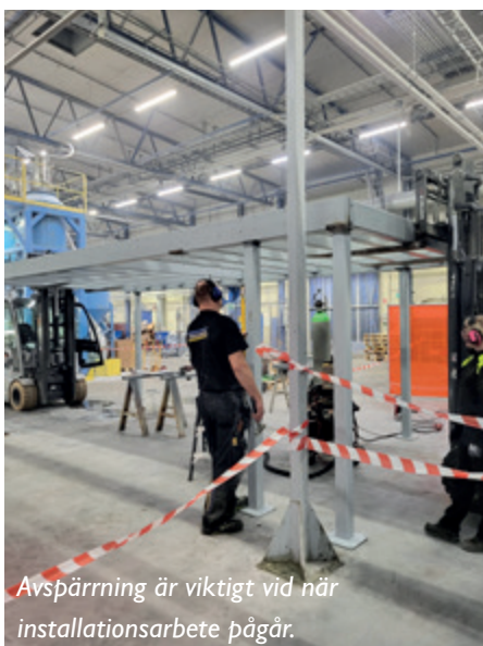
Avspärning är viktigt vid när installationsarbete pågår.