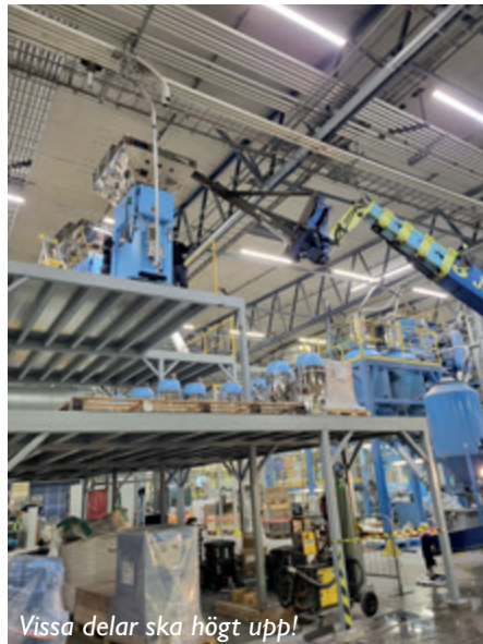
Vissa delar ska högt upp!