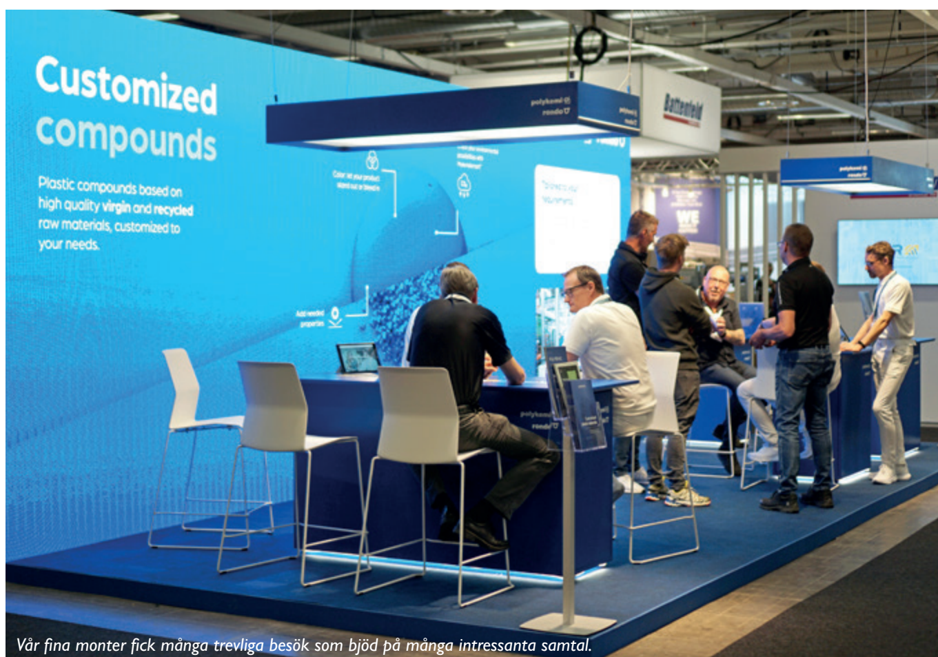
Vår fina monter fick många trevliga besök som bjöd på många intressanta samtal.

SÅ VAR DET DAGS IGEN FÖR NORDENS STÖRSTA RENODLADE MÄSSA FÖR PLAST- OCH GUMMIINDUSTRIN. ELMIA PRODUKTIONSMÄSSOR MED SEX PARALLELLA MÄSSOR DÄR ELMIA POLYMER ÄR EN AV DEM, HADE SAMLATS UNDER ETT OCH SAMMA TAK. HALLARNA MYLLRADE AV BESÖKARE SOM FICK TA DEL AV MASKINER OCH VERKTYG SOM FRÄSER, BOCKAR, VIKER, SKÄR OCH SORTERAR.