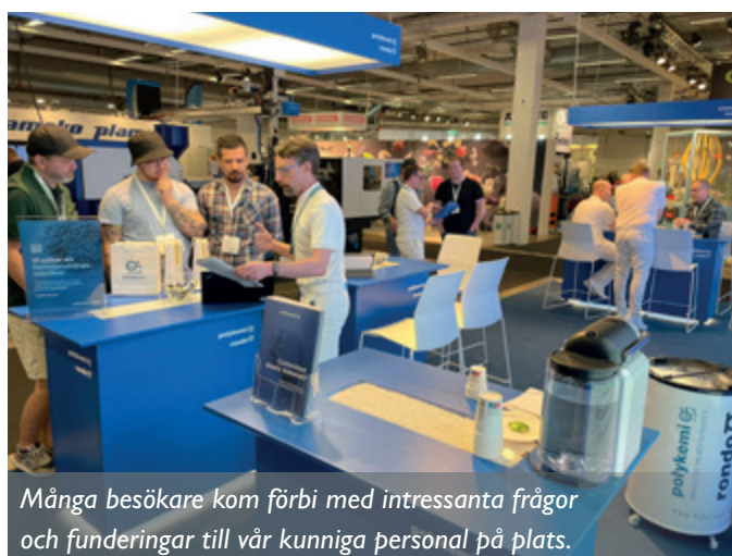
Många besökare kom förbi med intressanta frågor och funderingar till vår kunniga personal på plats.