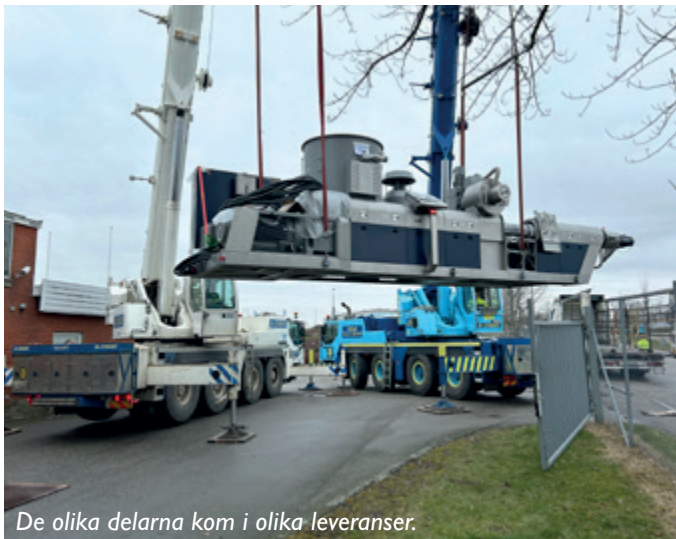
De olika delarna kom i olika leveranser.