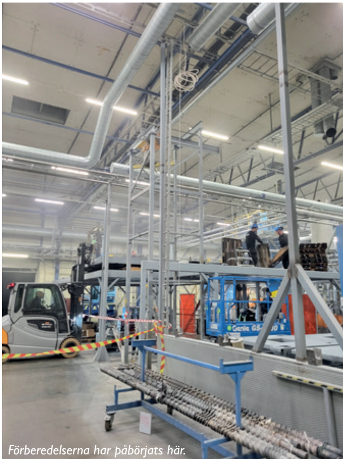
Föberedelserna har påbörjats här.

Den Stuttgartbaserade extrudertillverkaren Coperion är en av världens största tillverkare av extrudrar till olika branscher och MC18-modellen kan betraktas som deras flaggskepp. Det är alltså en kvalitetsmaskin vi införskaffat, vilket vi även fått bekräftat ända sedan vår första ZSK92 MC18 började producera plast i Ystad år 2008.