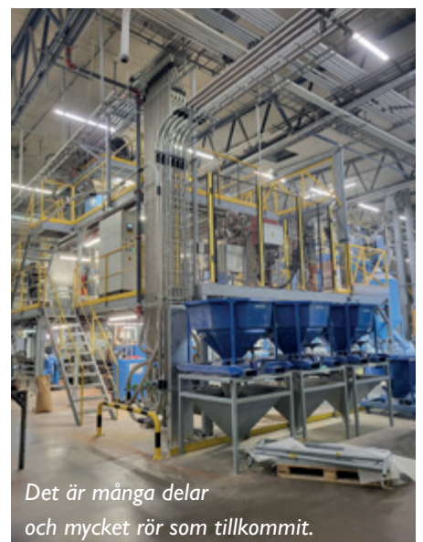
Det är många delar och mycket rör som tillkommit.