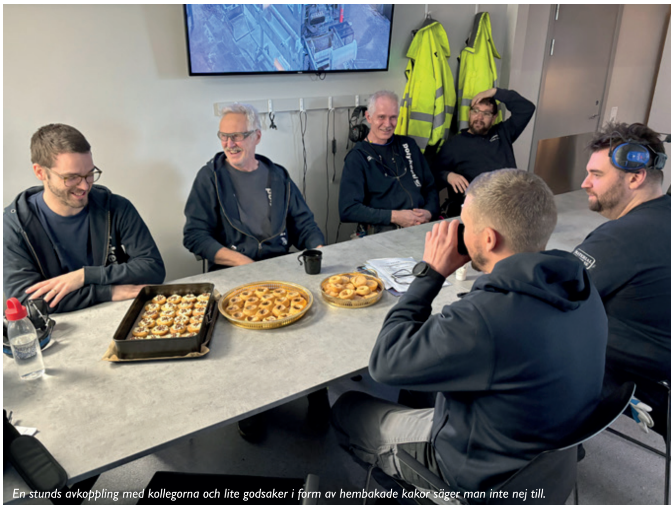
En stunds avkoppling med kollegorna och lite godsaker i form av hembakade kakor säger man inte nej till.

Finns det någon favoritbakelse bland kollegorna som de gärna vill ska återkomma några fredagar på rad?