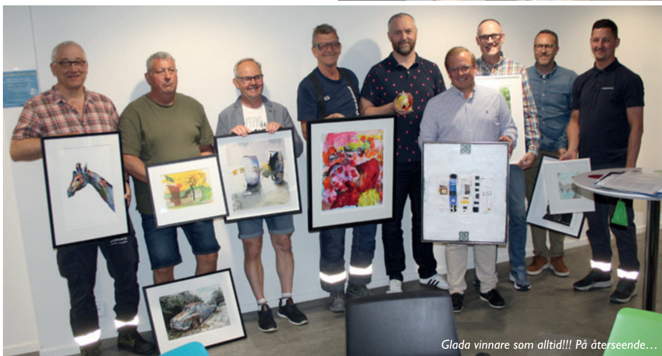
Glada vinnare som alltid!!! På återseende...