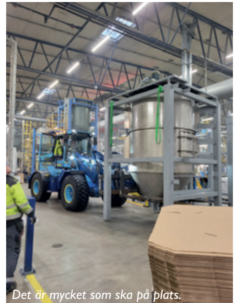
Det är mycket som ska på plats.