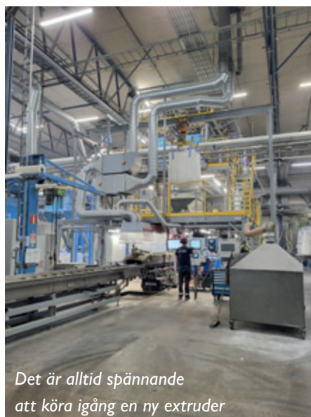
Det är alltid spännande att köra igång en ny extruder