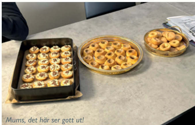
Mums, det här ser gott ut!

Nej det har jag inte, utan tycker enbart det är roligt, en hobby som är lite avkopplande samt att det är trevligt när andra njuter av något man bakat. Sen brukar det ju bli att man bakar när det är kalas i släkten eller till barnen som uppskattar det minst lika mycket som kollegorna.