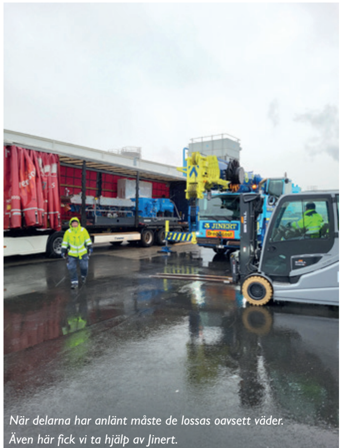
När delarna har anlänt måste de lossas oavsett väder. Även här fick vi ta hjälp av Jinert.