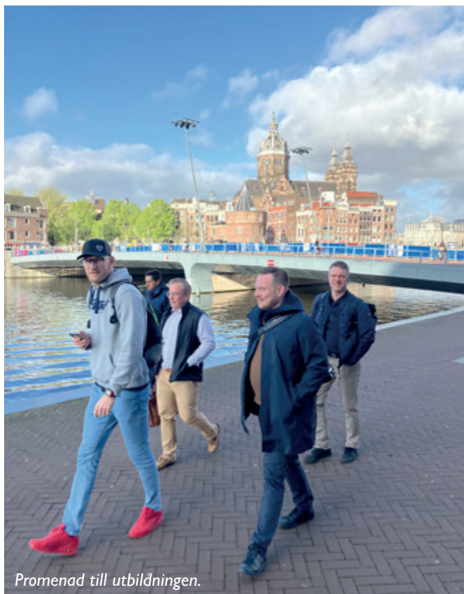
Promenad till utbildningen.