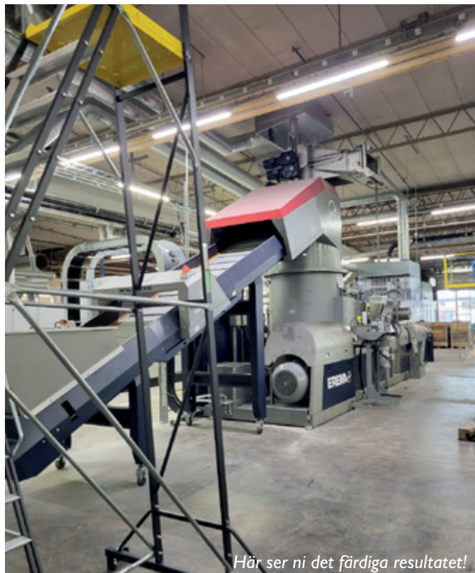
Här ser ni det färdiga resultatet!